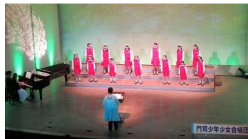
門司青少年少女 合唱団のみなさん