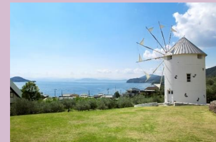
小豆島オリーブ公園

青く穏やかな海、真っ白な砂浜、どこまでも続く空。温暖な気候に恵まれ「オリーブの島」としても知られる小豆島。過去 3 度映画化された「二十四の瞳」は、すべて小豆島で撮影されました。